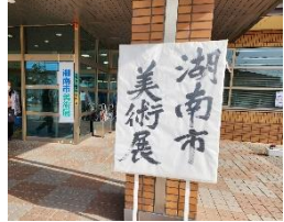
2月9日 湖西市美術展