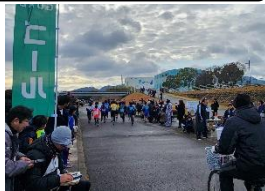
2月4日 湖西市駅伝大会