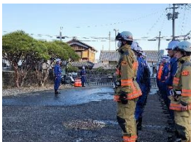
3月4日 消防分団別訓練