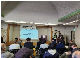
3月16日 SDGsまちづくりフォーラム