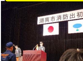
1月7日 湖西市出初式