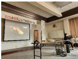
2月10日 子どものフォーラム