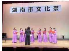
10月29日 湖南省文化祭