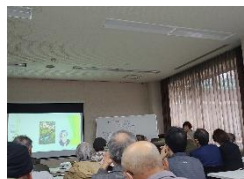
11月12日 「図書館」研修会