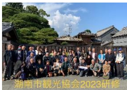
10月25日 観光協会研修