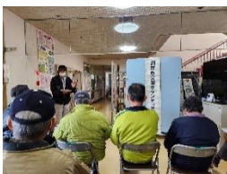
11月18日 災害ボランティア養成講座