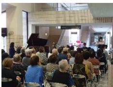
11月3日 ミュージックカフェ