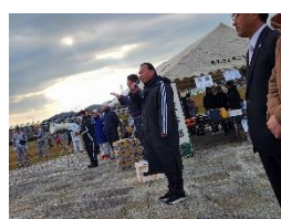
12月3日 マラソン大会