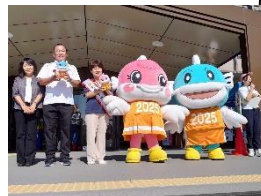
9月24日 スポーツフェス