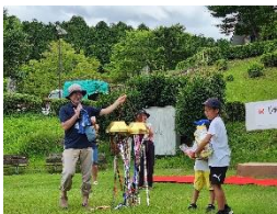
7月15日じゅらくの里オープン