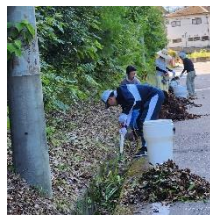
7月16日 宝来坂河川・環境整備