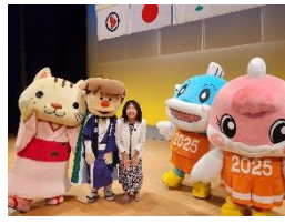
7月28日 国スポ障スポ実行委員会