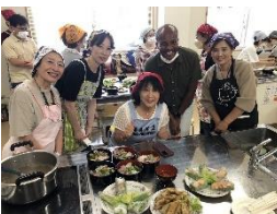
9月24日 おしゃべりクッキング