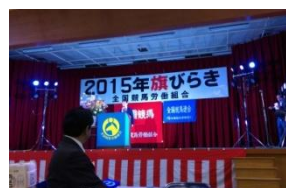
1/7 全国競馬旗びらき