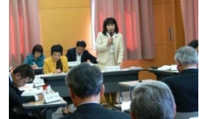
3/30 甲賀広域行政組合議会