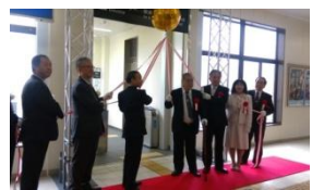
3/18 甲西駅バリアフリー完成