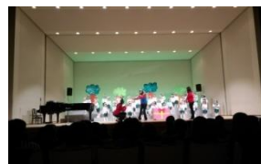
2/4 ひかり幼稚園発表会