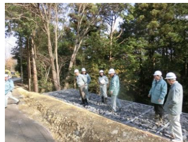
針東寺線 (美松苑付近)