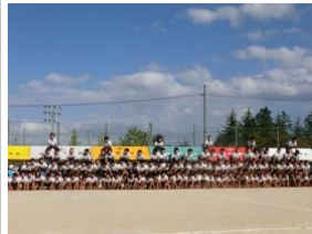
10/12 石部南小学校運動会