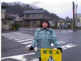
11/26～通学路横断誘導活動