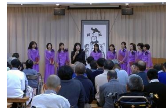
11/23 一妻寮 田村祭