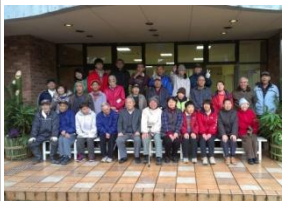
12/27 もみじあざみ門松作り