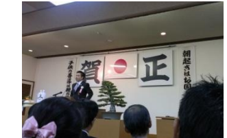
1/1 朝起き 元朝式