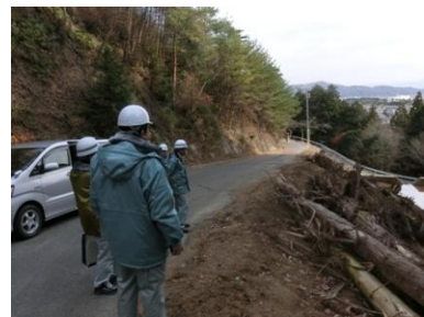
雨山公園 (山腹崩壊)