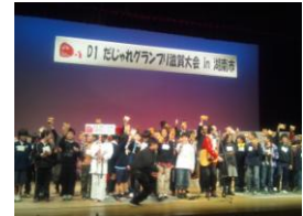
1/22 D=1 グランプリ