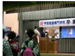
3/9 甲賀看護専門学校卒業式