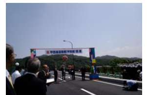
6/2 甲西橋開通記念式典