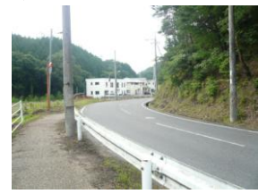
7/4美しかった宮ヶ谷線