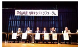
5/29地域まちづくりフォーラム